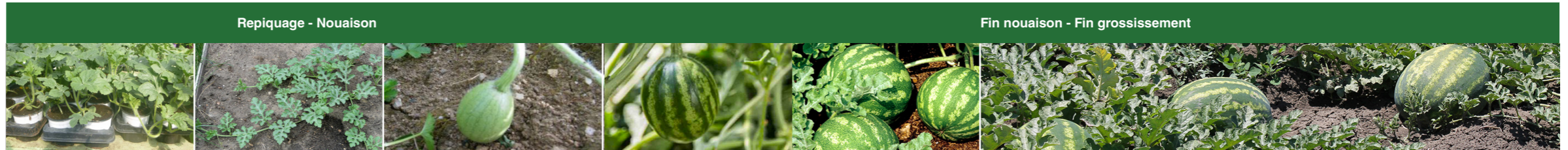
Repiquage - Nouaison