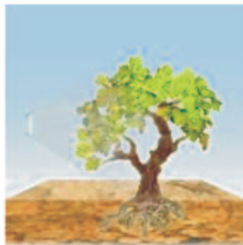
Traitement avec du MIKAL Flash