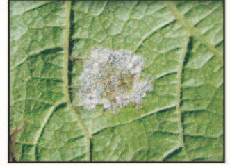
Mildiou sur feuille