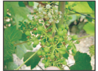
Mildiou sur grappe