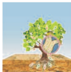
Système ascendante et descendante