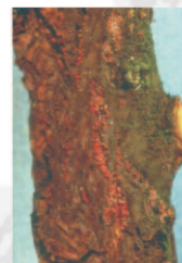
Chancre du collet