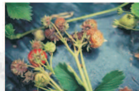
Mildiou de la fraise