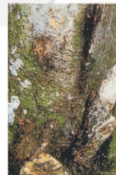
Gommose des agrumes