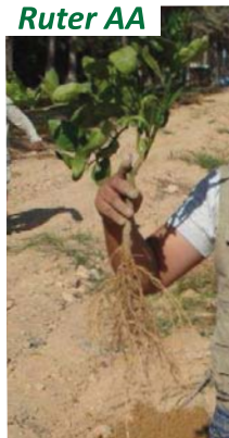
Effet de Ruter AA sur le développement racinaire