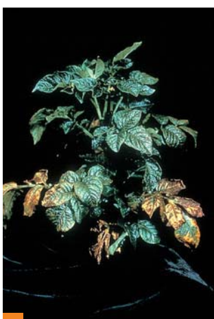
■ Carence en K sur pomme de terre