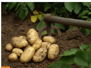
■ Pomme de terre traitée par Fainal K, Ain Defla, 2011